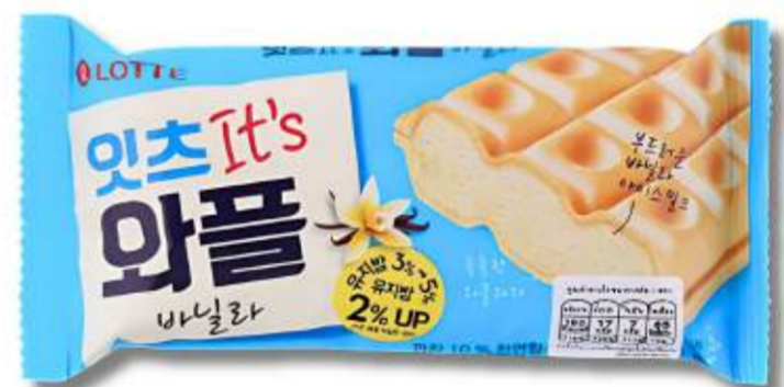
Galleta monaka (similar a una oblea), rellena de helado sabor a vainilla