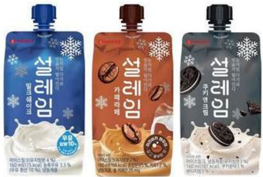
Granizados exprimibles, estilo frappé ó smoothie congelado