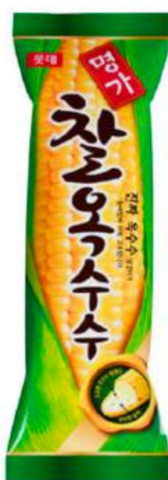
Galleta monaka (similar a una oblea), rellena de helado sabor a choclo