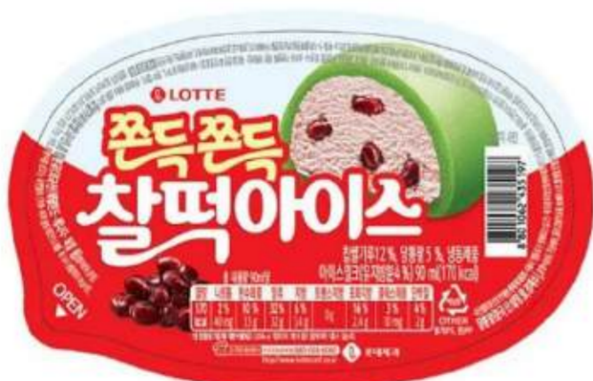
Mochi relleno de helado sabor a poroto dulce