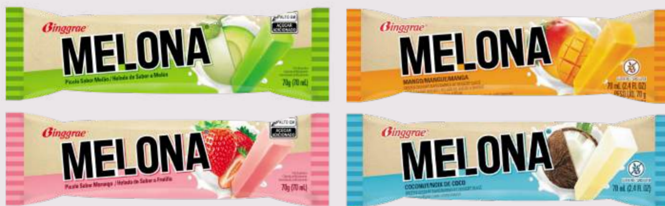
Paletas clásicas y cremosas sabor a fruta