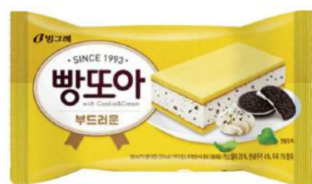
Sándwich relleno de helado sabor a cookies and cream

La disponibilidad de sabores y modelos puede variar, te sugerimos consultar con un garzón