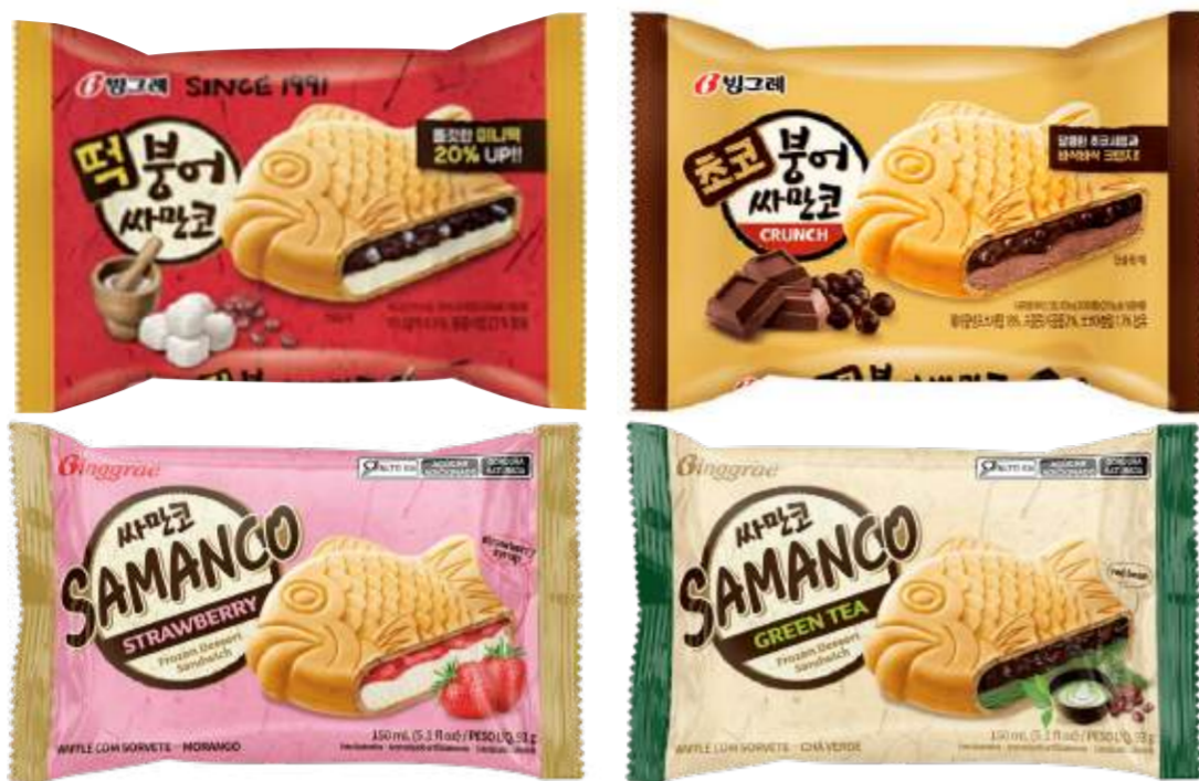
Galleta monaka (similar a una oblea), en forma de pescado, con relleno de distintos sabores de helado