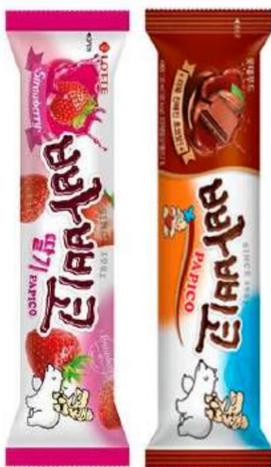
Tubo exprimible estilo frappé o smoothie congelado